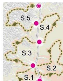
TRAZADO EN LINEA

2. El trayecto entre puntos de asistencia debe ser lo más corto posible. El tiempo de desplazamiento de los vehículos entre puntos de asistencia habrá de ser, como mínimo, inferior al 50% del tiempo previsto para la sección.