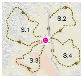
TRAZADO EN ESTRELLA